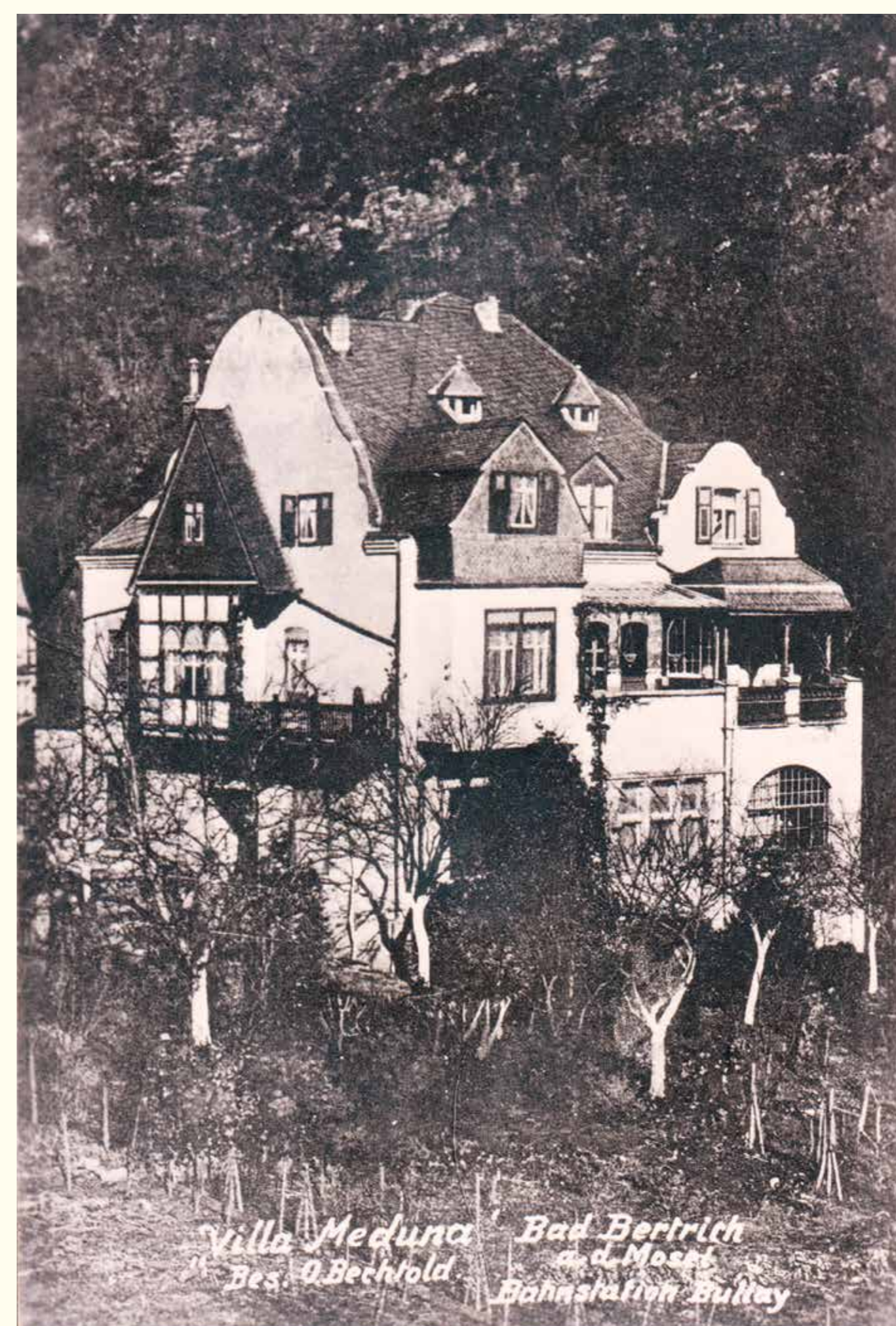
Villa Meduna, ein Domizil Clara Viebig in Bad Bertrich.

Am 40. Todestag Clara Viebig, am 31. Juli 1992, wurde in Bad Bertrich die Clara-Viebig-Gesellschaft gegründet. Sie hat es sich zum Ziel gesetzt, die Dichterin und ihre Werke wieder in Erinnerung zu rufen. Dazu dienen Seminare, Lesungen und Vorträge sowie die Erforschung ihres Lebens und Werkes und die Veröffentlichung von Dokumentationen und Materialien. Jährlich veranstaltet die Clara-Viebig-Gesellschaft mit der Tourist-Information Bad Bertrich im Juli einen Clara-Viebig-Tag.